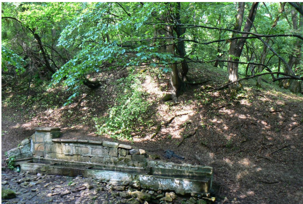
Горска чешма в землището на с.Балик - отд.48-ж

Целта на стопанисването е чрез подходящи мероприятия да се подобрят защитните и водоохранните функции на насажденията и се запазят от замърсяване водоизточниците и водоемите, които снабдяват селищата с питейна вода.